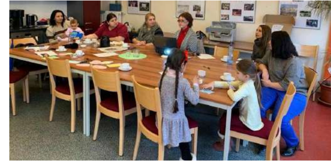
Foto: Elternseminar im Hamm 2019 J.

Die Deutsch-Bulgarische Elterninitiative „Jan Bibijan“ e.V. wurde 2011 in Münster gegründet und ist ein Zusammenschluss von bulgarischen und deutschen Eltern aus dem gesamten Münsterland, die ihren Kindern das Erlernen der bulgarischen Sprache und Kultur fördern möchten.