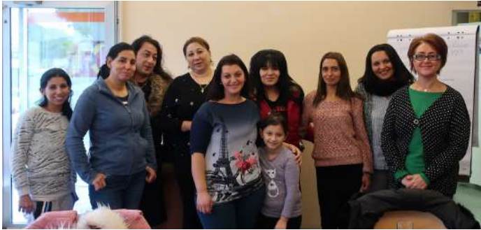
Foto: Elternseminar im Hamm 2020 J.

Mit dem Projekt setzt die Elterninitiative ihre erfolgreiche Seminarreihe für Eltern und Multiplikatoren in der Integrationsarbeit in den Städten Münster, Hamm und Ahlen fort.