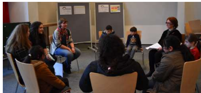
Foto: Kinderkonferenz für Grundschul Kinder aus Südosteuropa im Ahlen 2020 J.